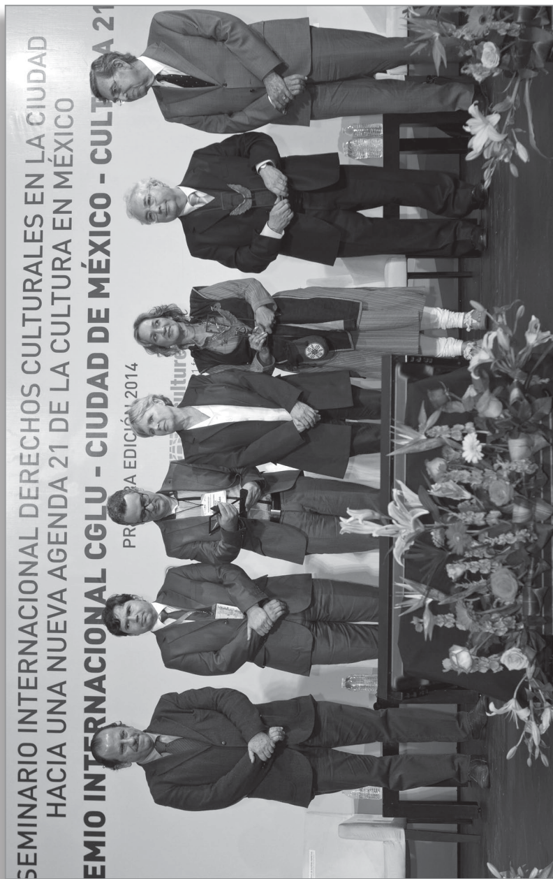
Manuel Castells, Farida Shaheed y el programa "Arena Cultura" del municipio de Belo Horizonte, Brasil, son galardonados en la primera edición del Premio Internacional CGLU-Ciudad de México a la Agenda 21 de la Cultura. Ciudad de México, 2014.