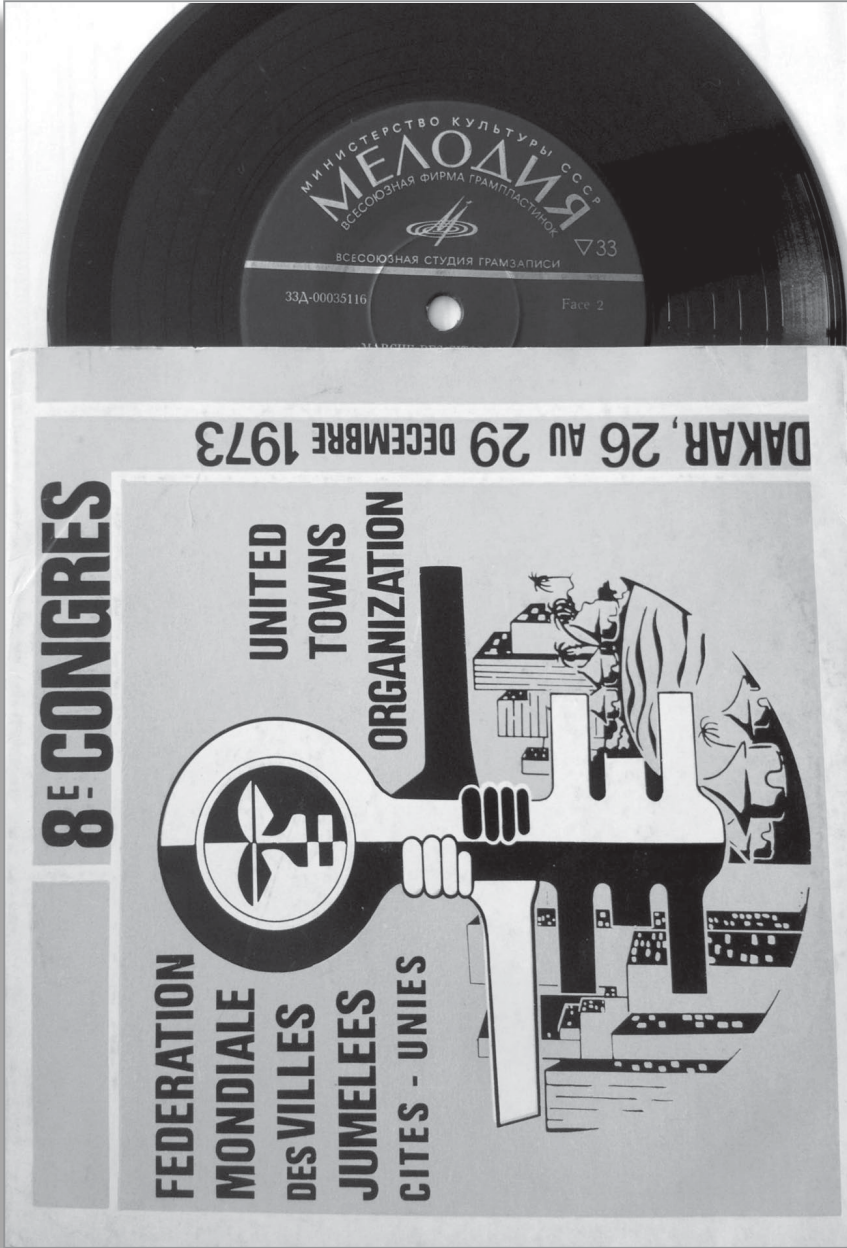
Disco producido en ocasión del Octavo Congreso Mundial de la Federación Mundial de Ciudades Hermanadas (posteriormente FMCU), incluye el "Himno de las ciudades hermanas" y la "Marcha de las ciudades unidas", 1973.