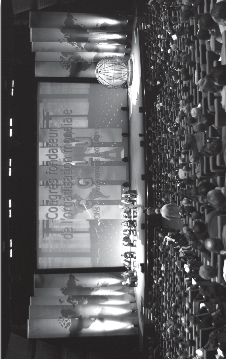
Congreso fundador de Ciudades y Gobiernos Locales Unidos (CGLU). París, Francia, 2004.