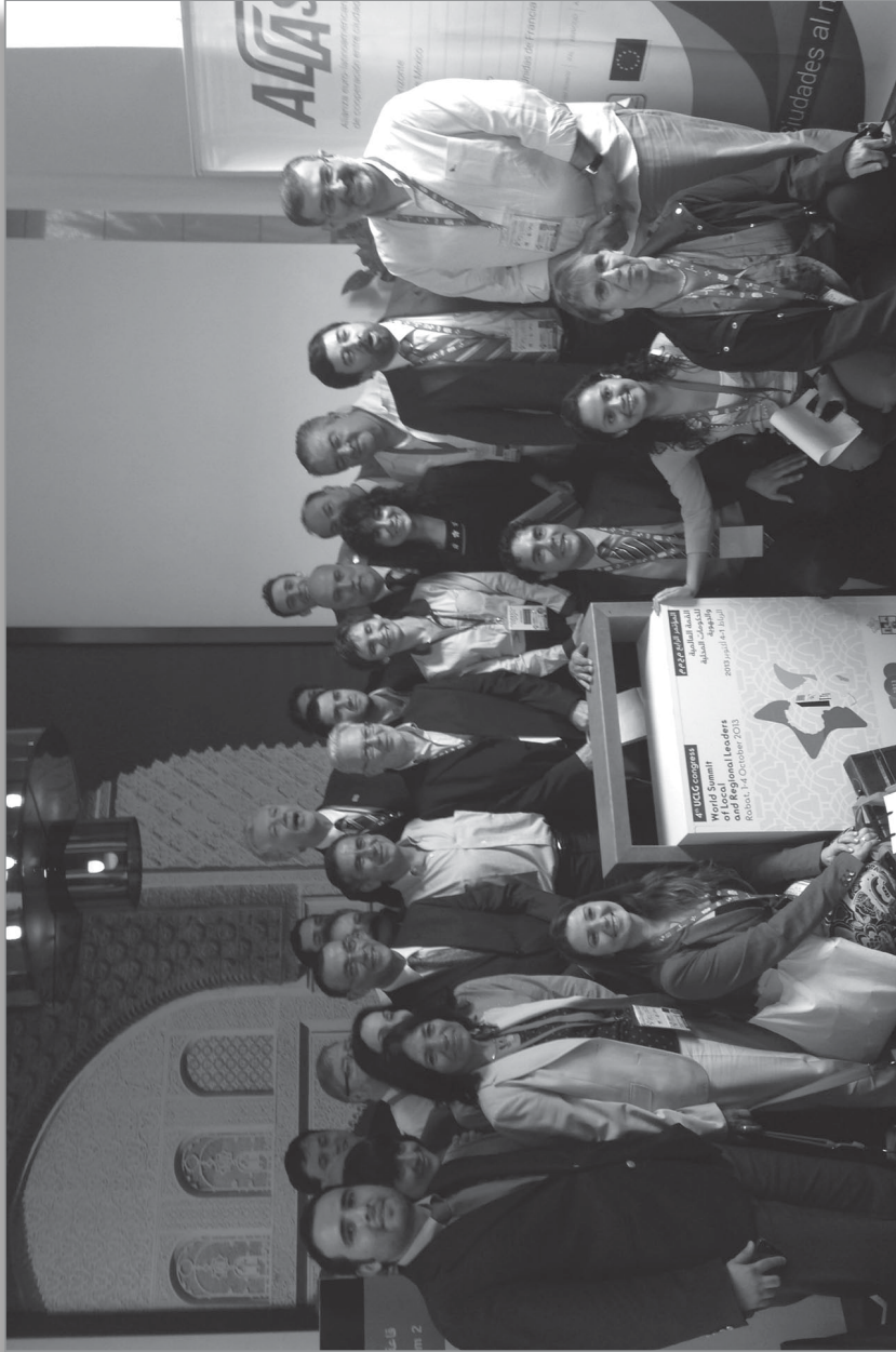
Augusto Barrera, alcalde de Quito, Ecuador, en representación del Proyecto AL-IAS, convoca a la reunión de alcaldes y autoridades locales de América Latina en el marco del Cuarto Congreso Mundial de CGLU, Rabat, Marruecos, 2013.