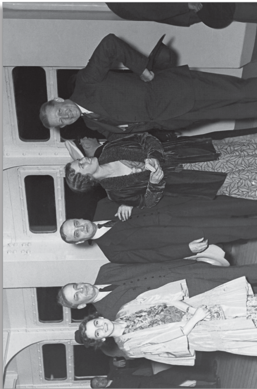
Durante el Sexto Congreso de la Unión Internacional de Autoridades Locales (IULA) en Berlín y Munich, Alemania, celebrado en 1936, se sumó la Asociación de Municipios de Estados Unidos. Delegación de alcaldes de Estados Unidos.