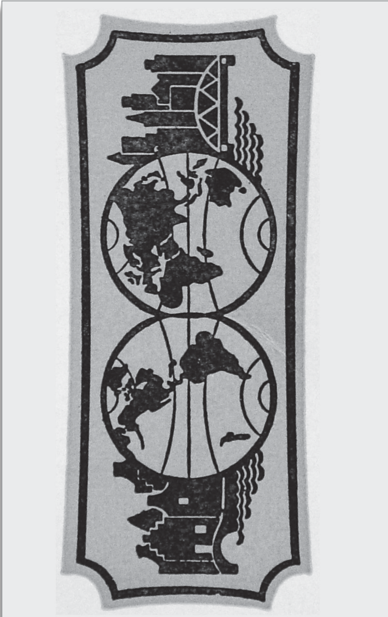
Logo de la Unión Internacional de Autoridades Locales (IULA), 1954.