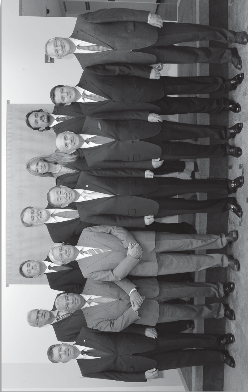
Ban Ki-moon, secretario general de Naciones Unidas, recibe a la delegación de autoridades locales y regionales en preparación de la Cumbre de Río+20, como parte del camino hacia la elaboración de los nuevos Objetivos de Desarrollo del Milenio, 2012.