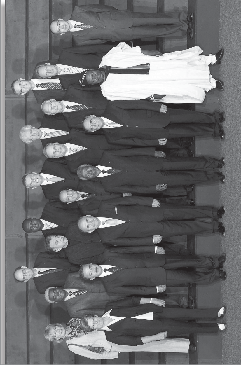
Kadir Topbas, alcalde de Estambul y Presidente de CGLU, encabeza la reunión de autoridades locales con Kofi Annan, secretario general de la ONU, con motivo de la creación del Comité Asesor de Autoridades Locales ante Naciones Unidas (UNACLA, por sus siglas en inglés). Nueva York, 2005.