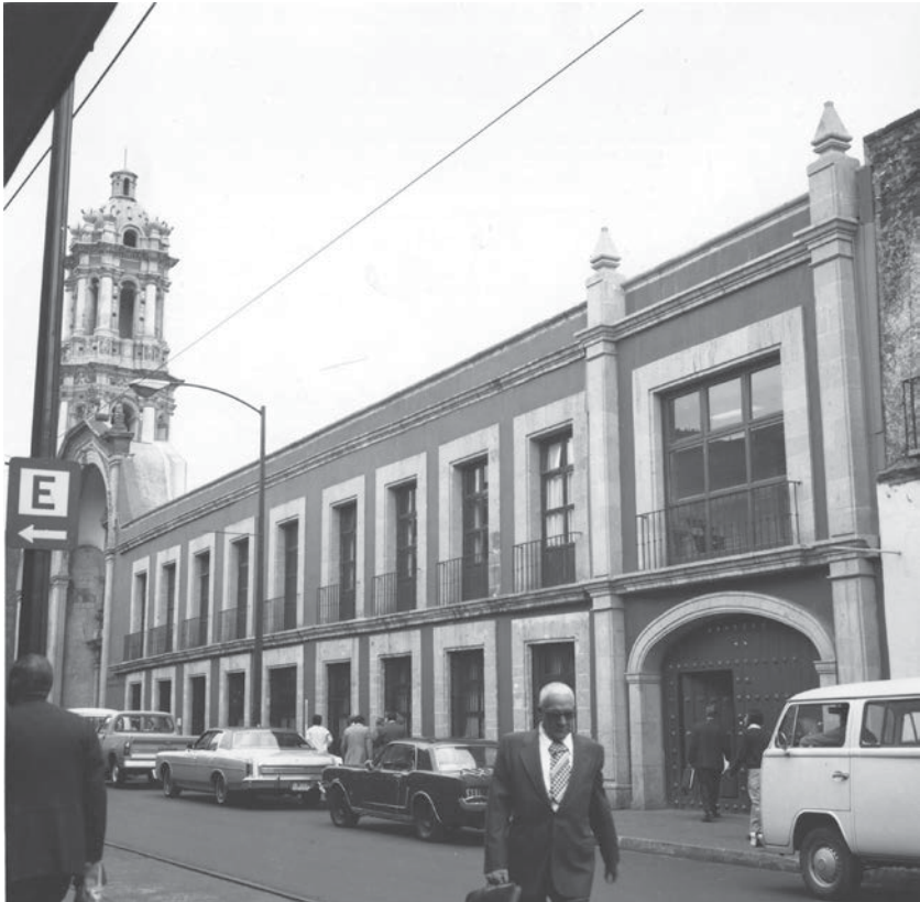
Las oficinas de la Comisión Nacional Bancaria (CNMH-FCRV, Centro Histórico, R1 M47 UT 76: MCXXIV-53, noviembre de 1977, CONACULTA-INAH-MEX. Reproducción autorizada por el INAH).