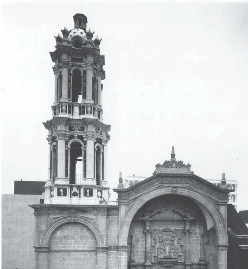
La torre del oratorio viejo después de su restauración (CNMH-FCRV, Centro Histórico, R1 M47 UT 77: DCLXXII-9, 20 de mayo de 1970, CONACULTA-INAH-MEX. Reproducción autorizada por el INAH).