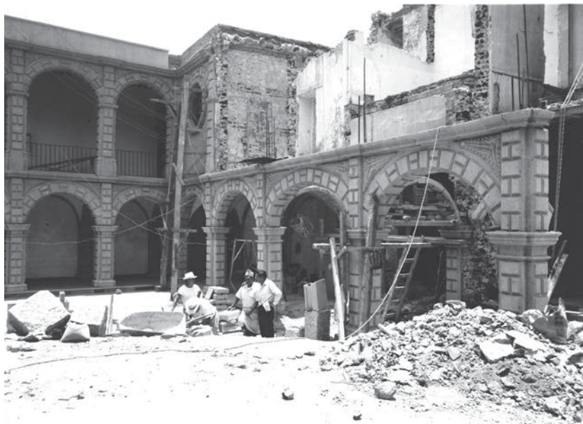
El oratorio "viejo" durante su reconstrucción y acondicionamiento (CNMH-FCRV, Centro Histórico, R1 M47 UT 77: DCLXXII-10, 20 de mayo de 1970, CONACULTA-INAH-MEX. Reproducción autorizada por el INAH).