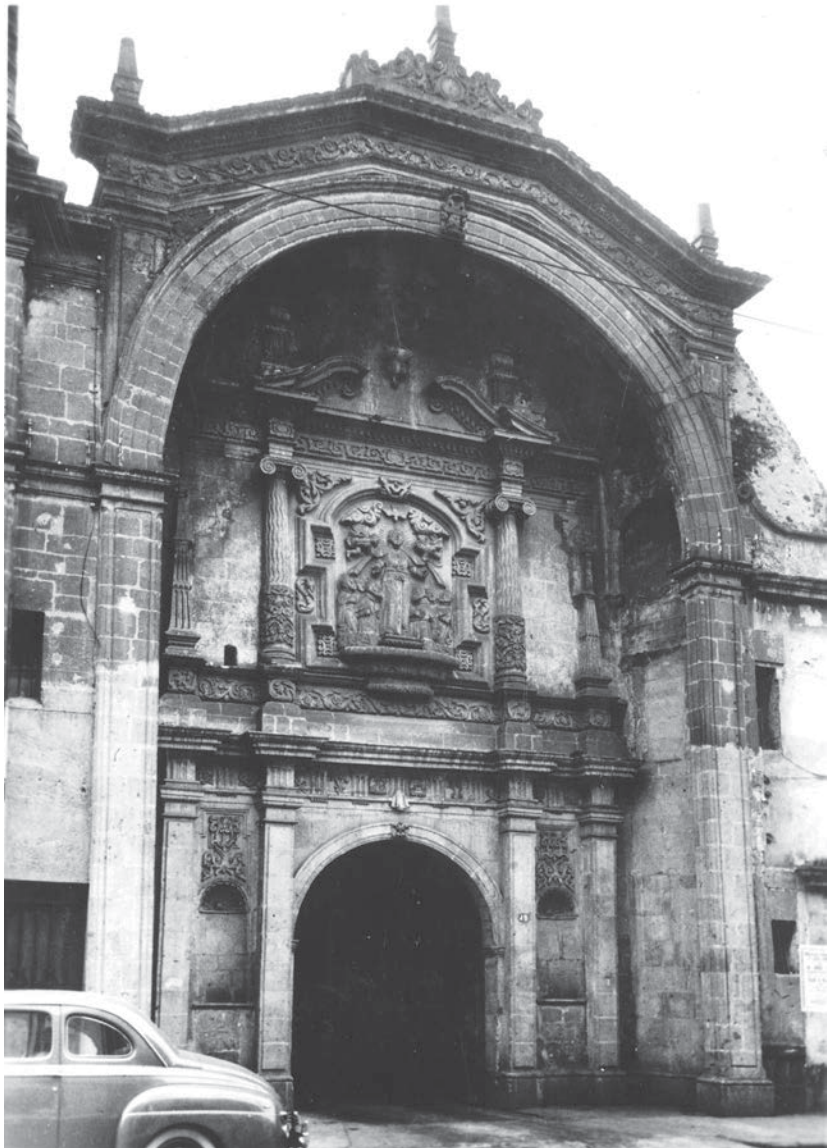
Portada de San Felipe Neri "el viejo" (CNMH-FCRV, Centro Histórico, R1 M47 UT 77: CLXII-79, s/f, CONACULTA-INAH-MEX. Reproducción autorizada por el INAH).