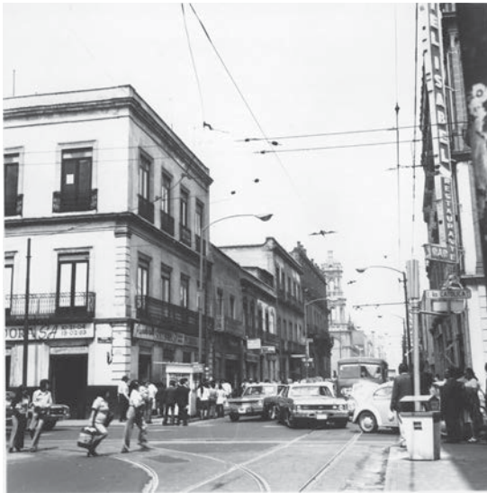
La torre del Oratorio desde la esquina de Isabel la Católica y República de El Salvador (CNMH-FCRV, Centro Histórico, R1 M47 UT 76: CMXXIV-36 y DCXCIII-89, 17 de agosto de 1974, CONACULTA-INAH-MEX. Reproducción autorizada por el INAH).