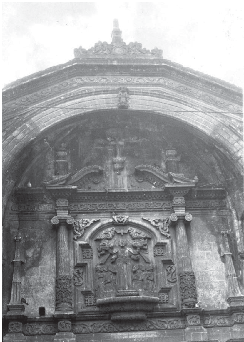
Detalle de la portada de San Felipe Neri "el viejo" (CNMH-FCRV, Centro Histórico, R1 M47 UT 77: SN-2, noviembre de 1965, CONACULTA-INAH-MEX. Reproducción autorizada por el INAH).