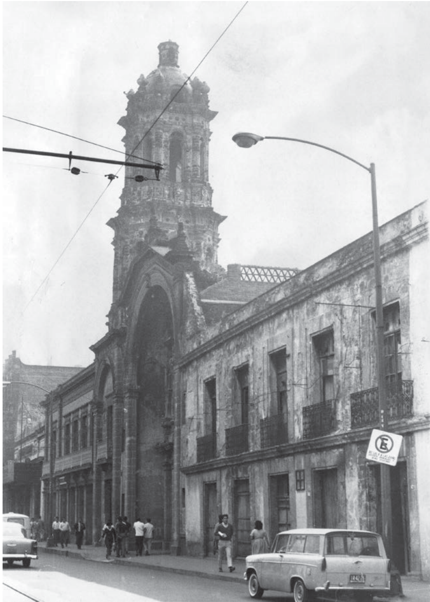
San Felipe Neri "el viejo". Para 1965, el edificio ya no estaba habitado ni había negocios en él; el Teatro Arbeau había sido clausurado definitivamente (CNMH-FCRV, Centro Histórico, R1 M47 UT 77: SN-3, noviembre de 1965, CONACULTA-INAH-MEX. Reproducción autorizada por el INAH).