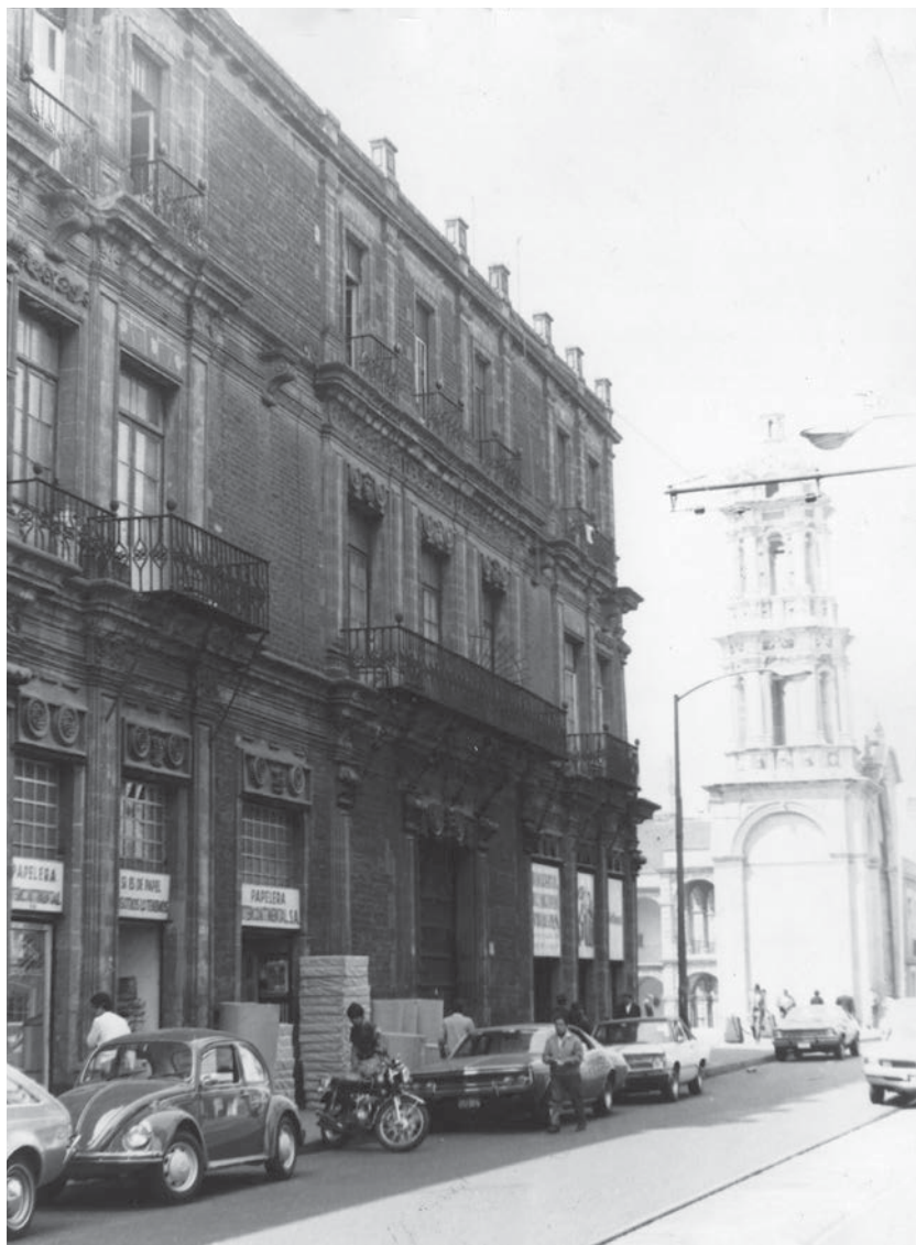
El antiguo Oratorio de San Felipe Neri y la casa de don Pedro Romero de Terreros, conde de Regla.