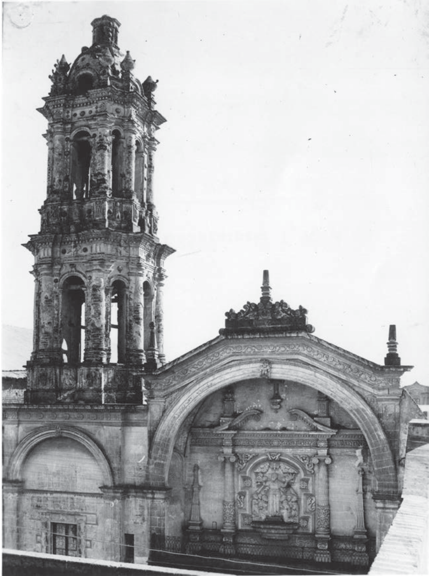
Torre de San Felipe Neri "el viejo" y detalle de la portada (CNMH-FCRV, Centro Histórico, R1 M47 UT 77: CLXII-78, s/f, CONACULTA-INAH-MEX. Reproducción autorizada por el INAH).