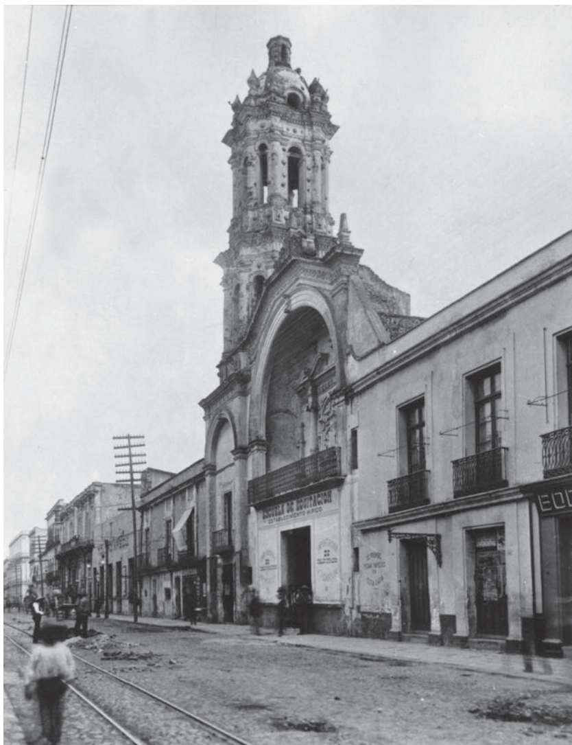
San Felipe Neri “el viejo”. En 1702, la iglesia se constituyó en oratorio y se decidió construir la portada de cantera labrada y levantar una torre. Al fondo se observa la entrada del Teatro Arbeau (CNMH-FCRV, Centro Histórico, R1 M47 UT 77: CDLXXIX-65, s/f, CONACULTA-INAH-MEX. Reproducción autorizada por el INAH).